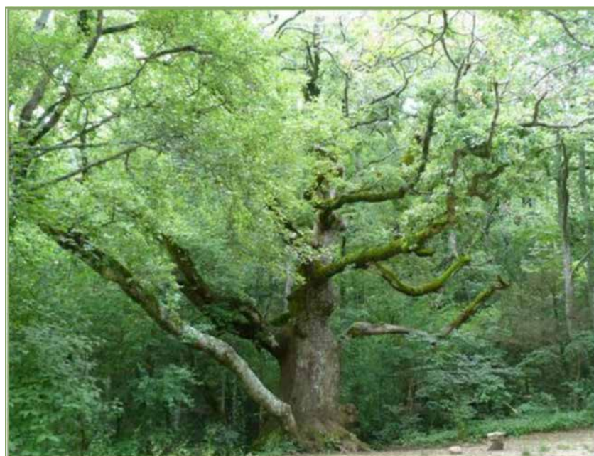
Arbre MERLIN

A.1.1 - Compléter les inventaires naturalistes : habitats et espèces