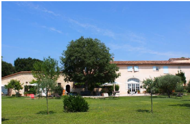
Le Moulin du Château, Saint Laurent du Verdon - Hôtel au naturel