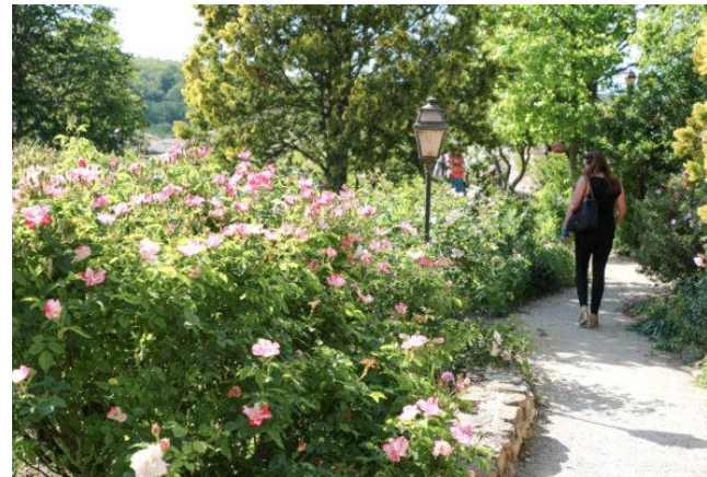
Jardin de l'abbaye de Valsaintes Jardin remarquable