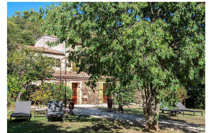
Hôtel Bastide Du Calalou, Aups Ecolabel Européen