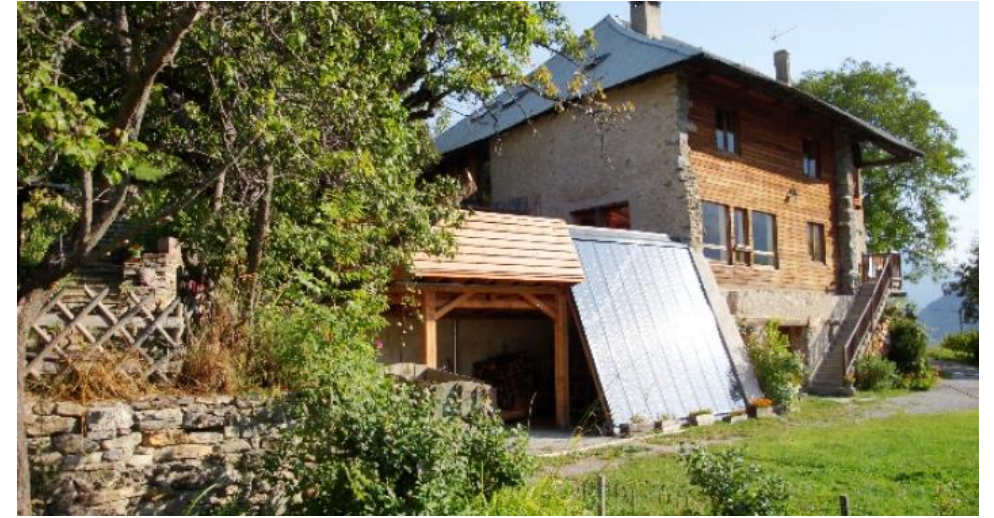
Gîte Parfums D'étoiles Chateauroux-Les-Alpes - Ecogite